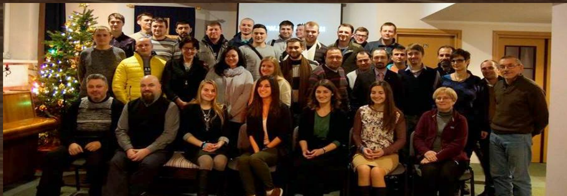
I Ukraińska Konferencja Misyjna, 2016