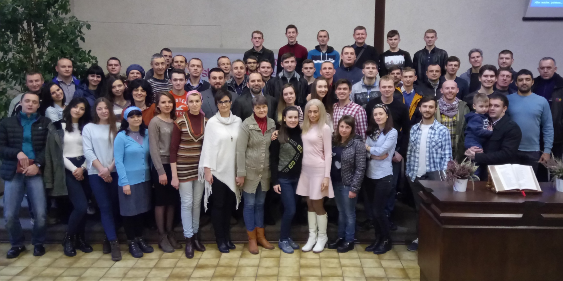
Wspólnota rosyjskojęzyczna w Gdańsku