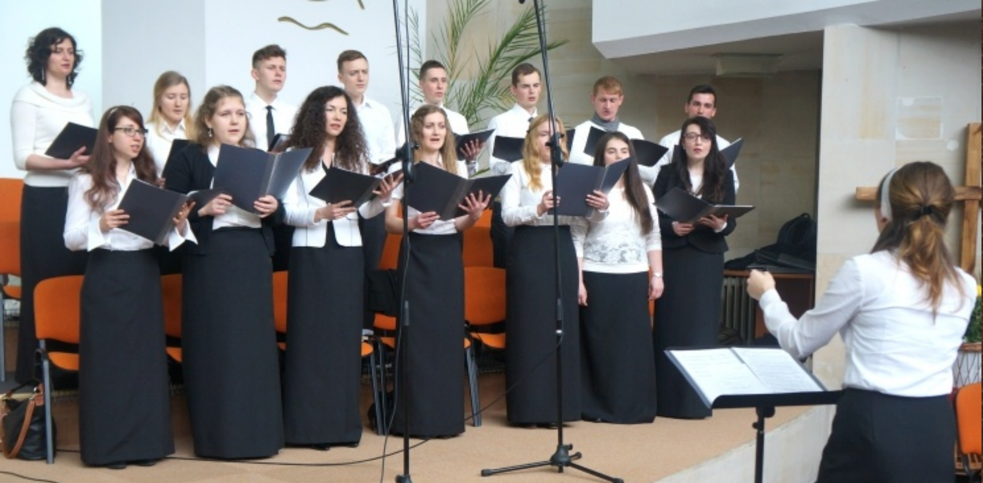
Chór podczas nabożeństwa w Warszawie