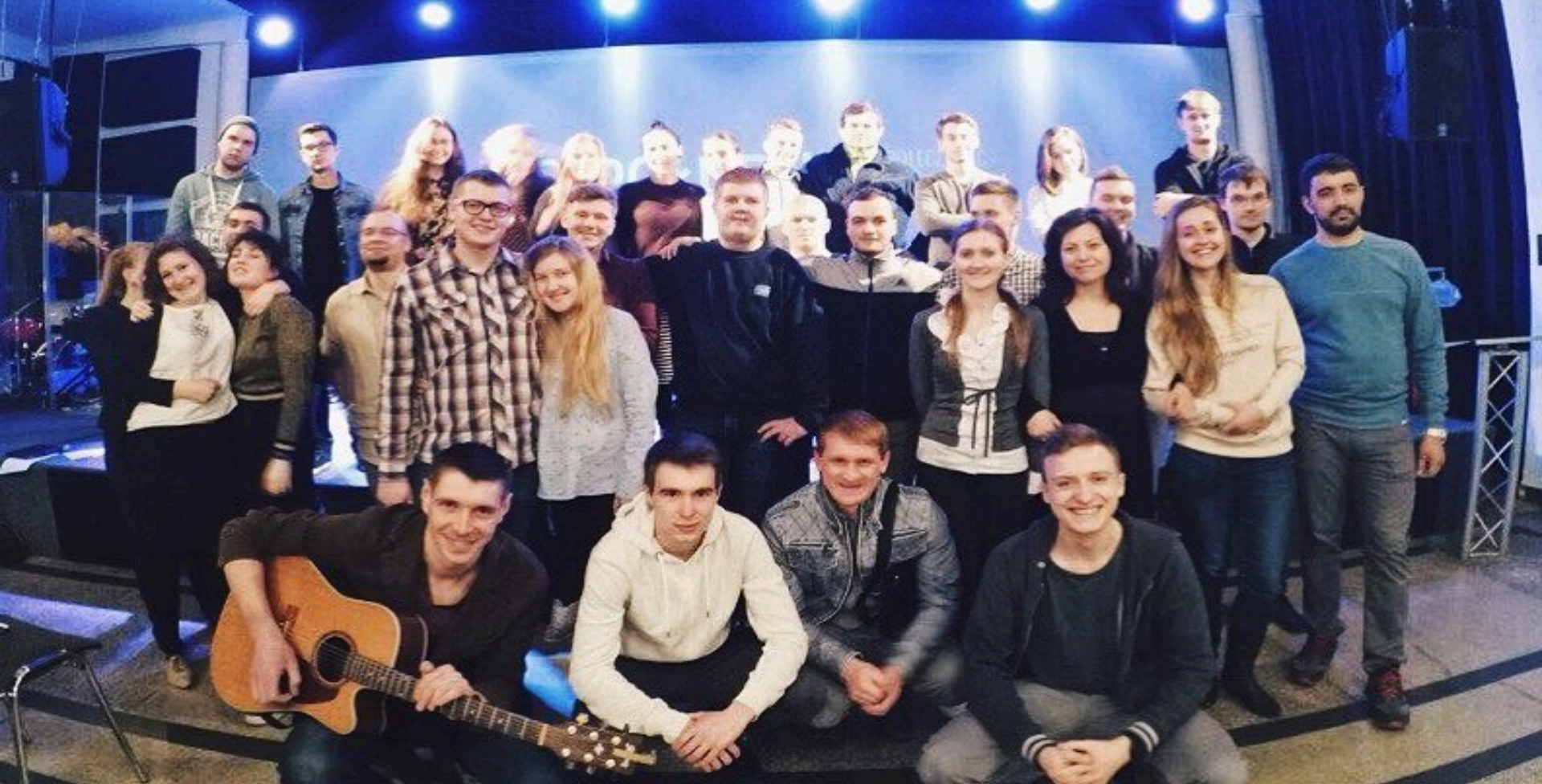
Młodzieżowy klub "Family House" w Warszawie