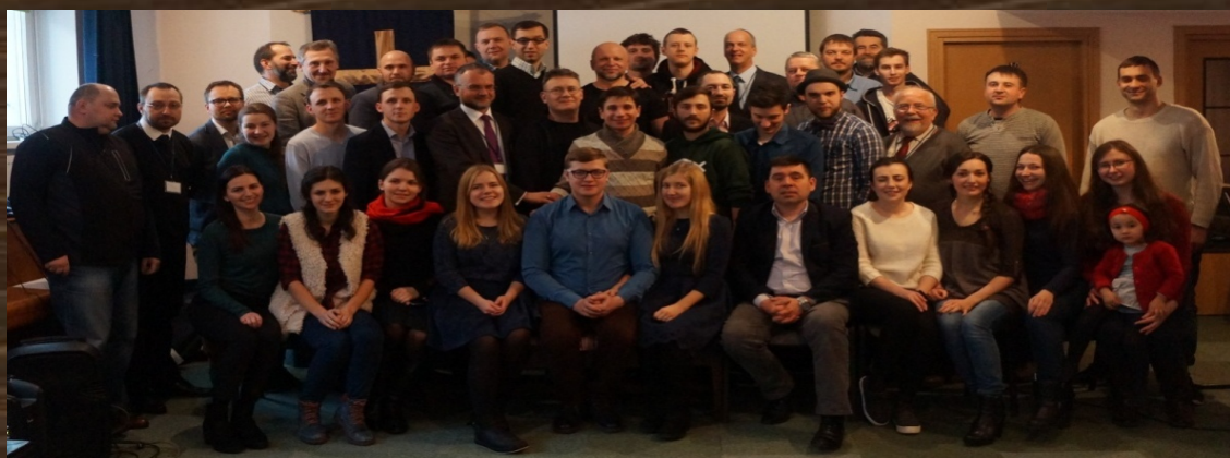
II Ukraińska Konferencja Misyjna, 2017