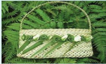
New Zealand Kete