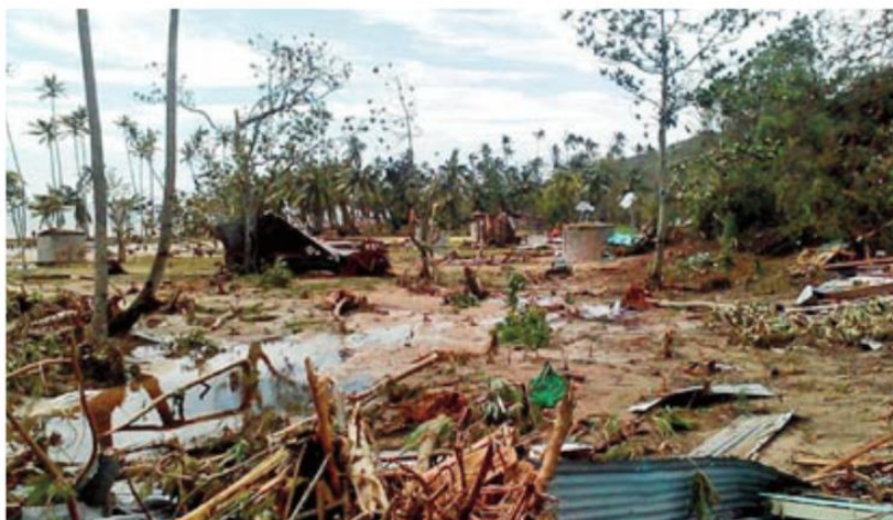
Fijian cyclone damage

Na początku 2017 roku, mieszkańcy Nabautolu w Ra, na Fiji oddawali część Bożemu miłosierdziu i dobroci Boga, dziękując za ocalenie życia podczas cyklony Winston. Życie wielu ludzi zostało przemienione. Nadal jednak zachęcamy się nawzajem do pokutowania i większego zaangażowania w budowanie Jego Królestwa. Bóg jest Bogiem drugiej szansy. Ja ogłaszam i ciągle mówię, po tych strasznych i pełnych cudów doświadczeniach, Bóg jest wciąż dobry ! Amen