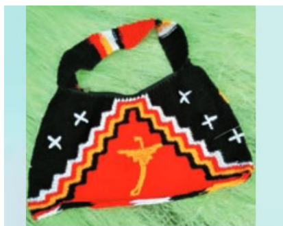
Paupa New Guinea Buillum

Apostoł Paweł pisał, że jesteśmy jak gliniane naczynia, w których przechowywany jest skarb. Prawdziwa moc jest z Boga, a nie z nas (2 Kor4:7). Na Pacyfiku Paweł mógłby powiedzieć, że jesteśmy jak słomiane kosze, w których przechowywany jest skarb, a Boża chwała może być widoczna przez dziury w splotach.